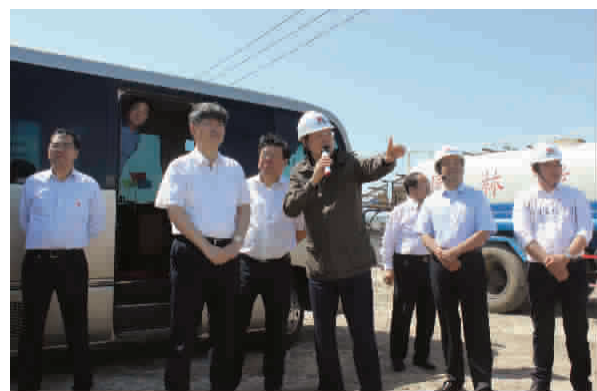
图为泰地石化集团李临总裁(左四)向沧州市市长梅世彤(左二)介绍码头建设及规划情况。