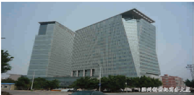
温州新世纪房地产开发有限公司开发的温州华星大厦，荣获温州市质量瓯江杯奖；温州新世纪商务大厦蝉联“瓯江杯”和“钱江杯”后，在2012年再获“国家优质工程奖”殊荣（工程建设质量的最高荣誉），也是我集团公司创建以来首个获得国家级的质量最高荣誉奖项。