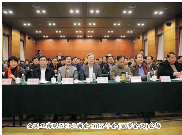
全国工商联石油业商会 2016 年会(理事会议)会场