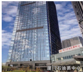
厦门石油交易中心