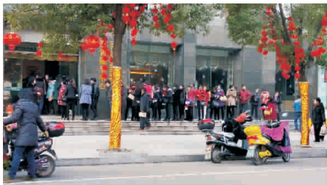
图为:前来销售部排队领取小礼物的微友们。

最后,王清平总经理在会议上进一步强调,我们要正确对待目前面临的销售问题,想尽一切办法,采取一切措施抢抓机遇。要充分把握控股集团投入销售奖励力度的有利时机,掀起房产销售新高潮。公司上下要团结一致,共讲和谐氛围,各部门管理人员要以身作则,勇于承担责任,做好本职工作。公司各职能部门要严格按照控股集团的专题会议要求与指示,不折不扣给以落实,确保各项目标任务的圆满完成! (陈忠荣)