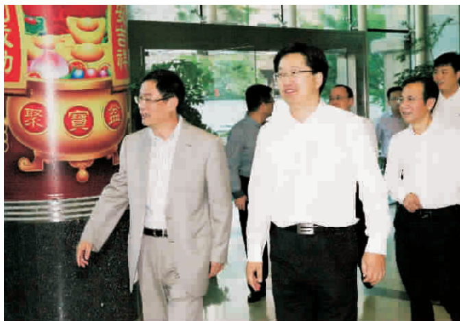
温州市市长陈金彪(左二), 泰地集团董事局主席张跃(左一)。

全国政协委员、全国工商联副主席传化集团董事长徐冠巨、省接待办领导一起陪同考察。 本报记者