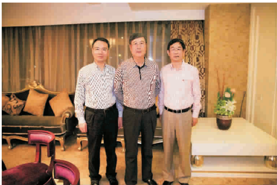
全国政协原副主席、中华全国工商联名誉主席黄孟复(中者), 全国工商联石油商会会长、泰地集团董事局主席张跃(右一)、全国政协委员、全国工商联副主席、传化集团董事长徐冠巨(左一)。

本报讯 10月12日, 原全国政协副主席、中华全国工商联名誉主席黄孟复莅临集团调研指导, 是继4月16日集团考察后的再度来访。