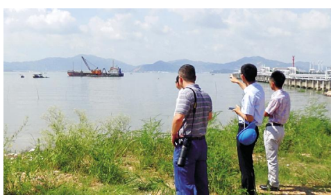
图为船机进场作业时的情景。

回顾项目自开工以来遇到的各种困难,真可谓一波三折。码头工程项目在2月26日取得了厦门港口局同意开工建设的批复,3月3日取得了厦门海事局的“水上水下活动许可证”,故此,我司项目工程施工手续完备,具备了开工条件。我司委托的项目施工单位、监理单位已于3月初进驻现场,并进行项目围墙和海域抛沙回填施工