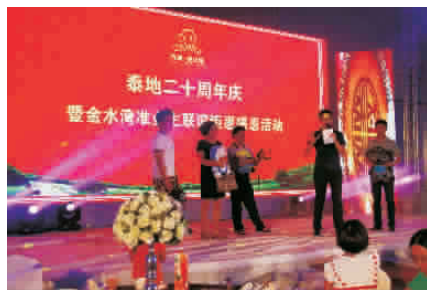
庆典晚会为业主们准备了精彩的歌舞表演及互动游戏活动。