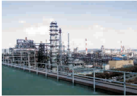
图为sk集团的大型炼油企业