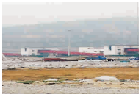
三、五罐组承台砼完成

进,一切以工程为主,各部门恪尽职守,通力协作,以质量为根本,以进度为目标,以团队为保障,全力以赴完成今年的建设任务。