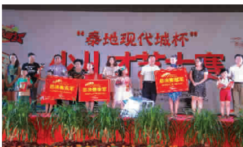
图为“泰地现代城少儿才艺大赛”总决赛颁奖现场

上分为声乐、舞蹈、器乐、表演、书画五类。经过前几场淘汰赛的洗礼,此场比赛中,小选手们舞台经验更加丰富,个个化身成勇敢的王子或优雅的公主,激情拉丁,魅力四射;歌声优雅,令人动容;劲爆街舞,High翻全场;古筝演奏,余音绕梁;戏曲国粹,视听享受;现场绘画,花开富贵,让人咋舌惊叹!各种才艺轮番上阵,小选