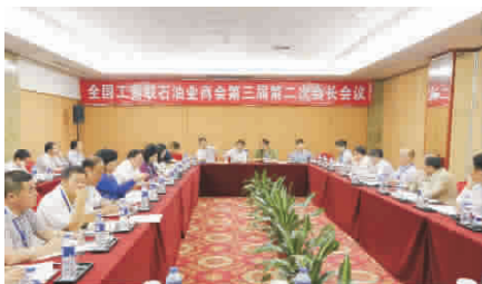
全国工商联石油业商会第三届第二次会长会议

“‘民间投资36条’实施细则需要根据实际情况不断完善、补充, 进一步提高可操作性。”5月29日, 在厦门召开的全国工商联召开的部分直属行业商会负责人和民营企业座谈会上,