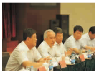
全国政协副主席、全国工商联主席王钦敏左二, 国家发改委党组书记、主任徐绍史左三

现有的石油市场体系没有和国际接轨, 无法及时反映国内市场供求关系和消费结构的变化, 更无法将国内石油市场的价格变化反馈给国际市场, 从而参与国际油价的形成; 国内原油、成品油进口与成品油批发皆由国有大型石油企业控制的现状, 形成了垄断, 既增加了进口成本, 又导致市场信息扭曲, 使我国许多地方出现“油荒”, 油价居高不下, 以及与国际油价背离等现象, 广大消费者反映强烈; 行政性垄断是导致现行