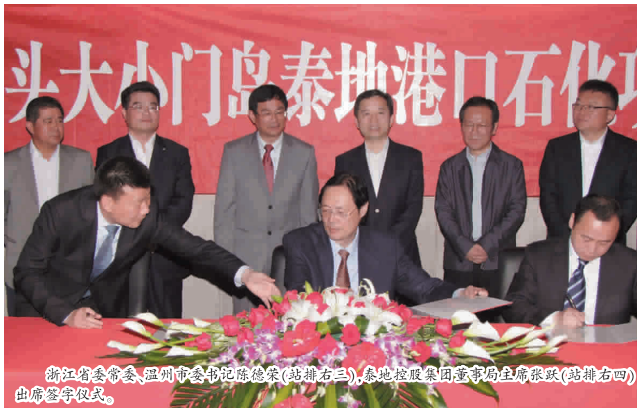
浙江省委常委、温州市委书记陈德荣(站排右三),泰地控股集团董事局主席张跃(站排右四)出席签字仪式。

顺利签订,在签字仪式上陈德荣书记给予了高度的肯定。这当中固然有双方合作的诚意,以及良好的合作基础。同时也反映出我们泰地集团有一个敢想敢闯、共谋大事的领导班子;有一支技术过硬、高效协作的专业团队;高效率的运作机制为成功的签订提供了保证。