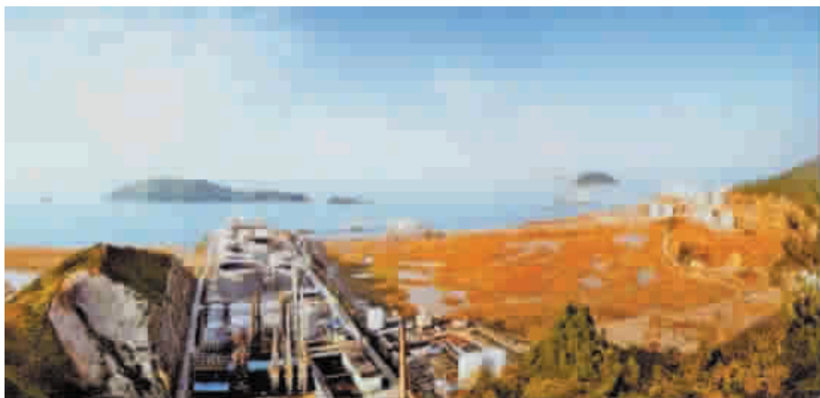
温州港大小门岛实景图