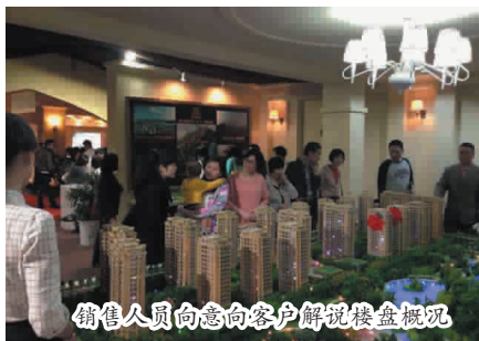
销售人员向意向客户解说楼盘概况

泰地房产公司沿袭今年“效益年”的主要精神,通过合理布置,压缩布展经费,不追求奢华浪费,既体现简洁大方、功能实用;又以