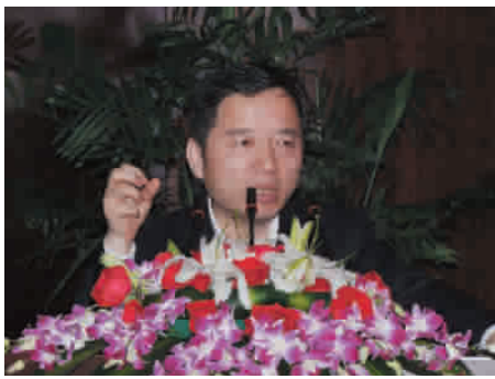
省委常委、温州市委书记陈德荣到会祝贺并讲话