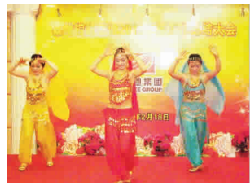
周口公司表演的印度舞蹈,洋溢着欢快的节奏,引起了全场的共鸣。