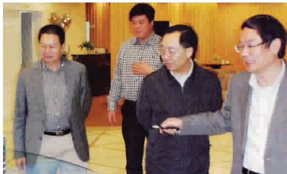
全国工商联黄小祥副主席(右二)在泰地集团董事局主席张跃(右一)的陪同下,来到厦门海西中心进行考察。

视察结束时,黄副主席与董事局张跃主席以及中心工作人员一一亲切握手辞行。(本报记者文/郭斌摄)